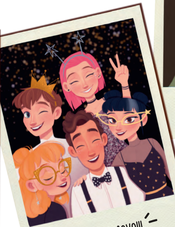
feliz ano novo!!!