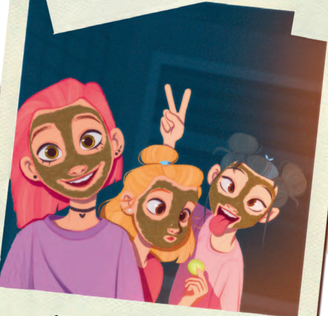
festinha do pijama! ♥