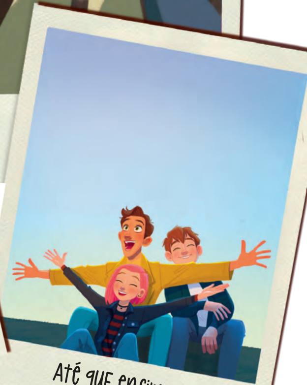
Até que enfim o inverno acabou!